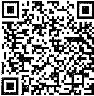
ระดับชั้นมัธยมศึกษาปีที่ 1