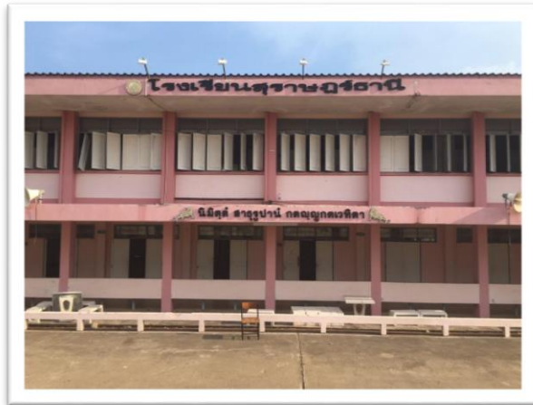
ด้านหน้าอาคาร