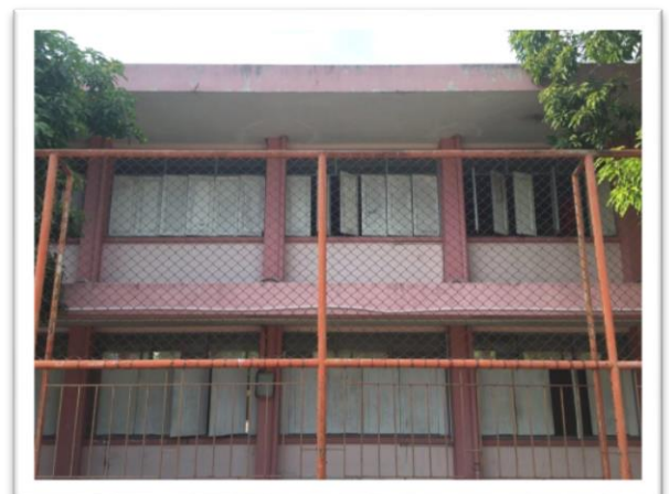
ด้านหลังอาคาร