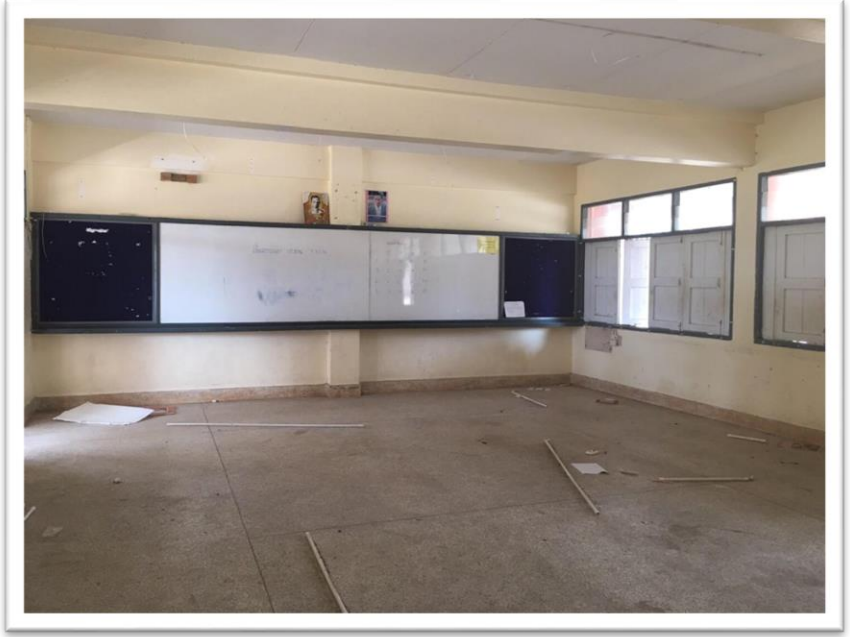
ภายในอาคาร ชั้น ๑