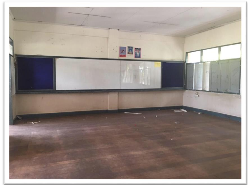
ภายในอาคาร ชั้น ๒