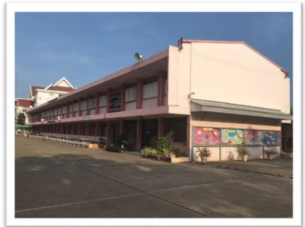
ด้านข้างอาคาร